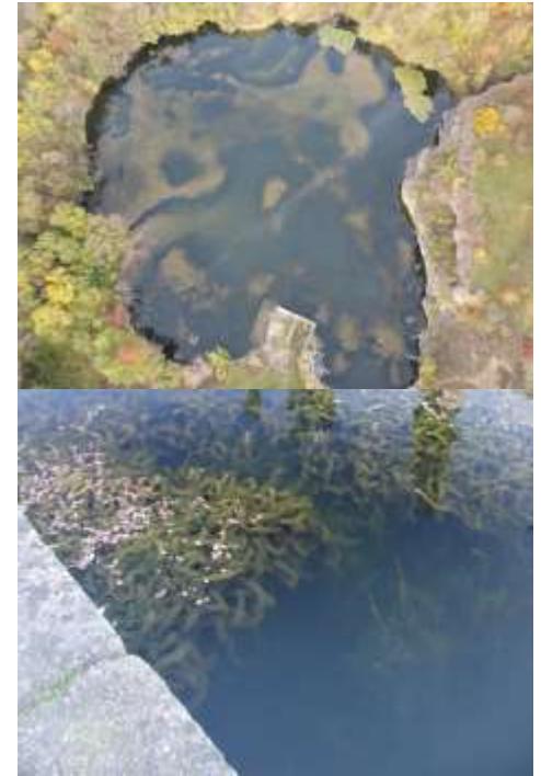
stolístek vodní - Velim