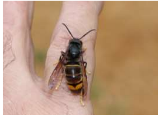
sršeň asijská – 3 lokality