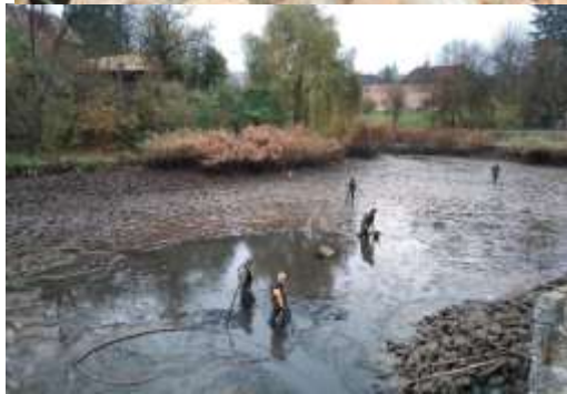
rak mramorovaný – 2 lokality