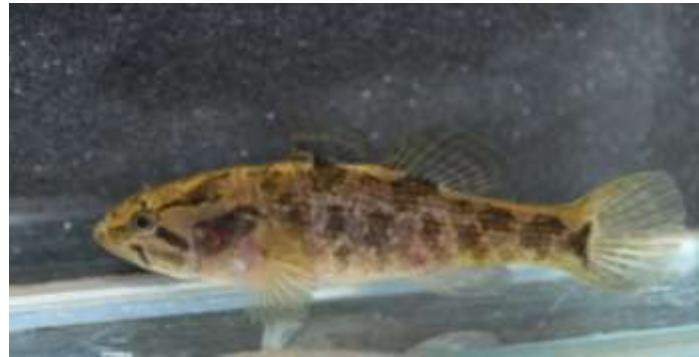
hlavačkovec Glenův - Rokycansko